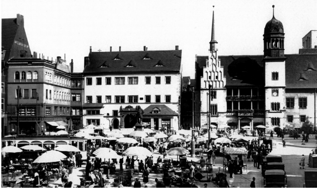
Markt 23 (links), Ratswaage (Mitte), Altes Rathaus und Turm des Ratshofes (rechts) um 1930

Oberbürgermeisterin Szabados „versprach [...], den Platz auf dem Markt freizuhalten, an dem das Rathaus einst stand. Vielleicht werde es ja in 20 oder 30 Jahren wieder aufgebaut.“ (Mitteldeutsche Zeitung, 18.4.2008, Seite 13)